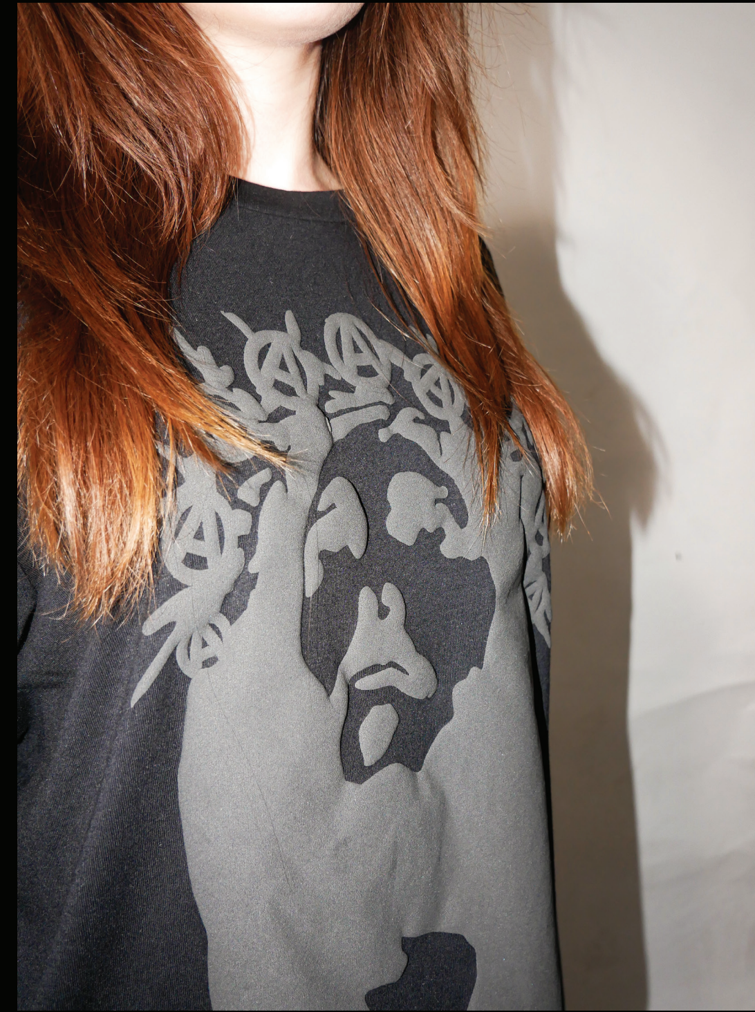
JESUS WOULD RIOT - LONGSLEEVE

Dit is geen gewone trui. Het kledingstuk is een militaire sweater uit 1970. Op de stof is een palmboom gedrukt, omgeven door een anarchiesymbool en sterren. De combinatie van deze elementen creëert een gelaagd beeld. De zomerse palmboom als symbool van vrijheid en hoop, botst direct met de militaire herkomst van het kledingstuk. Het is een anti-oorlogsstatement verpakt in zomerse beelden, alsof de zomer die nooit kwam toch ergens blijft bestaan.