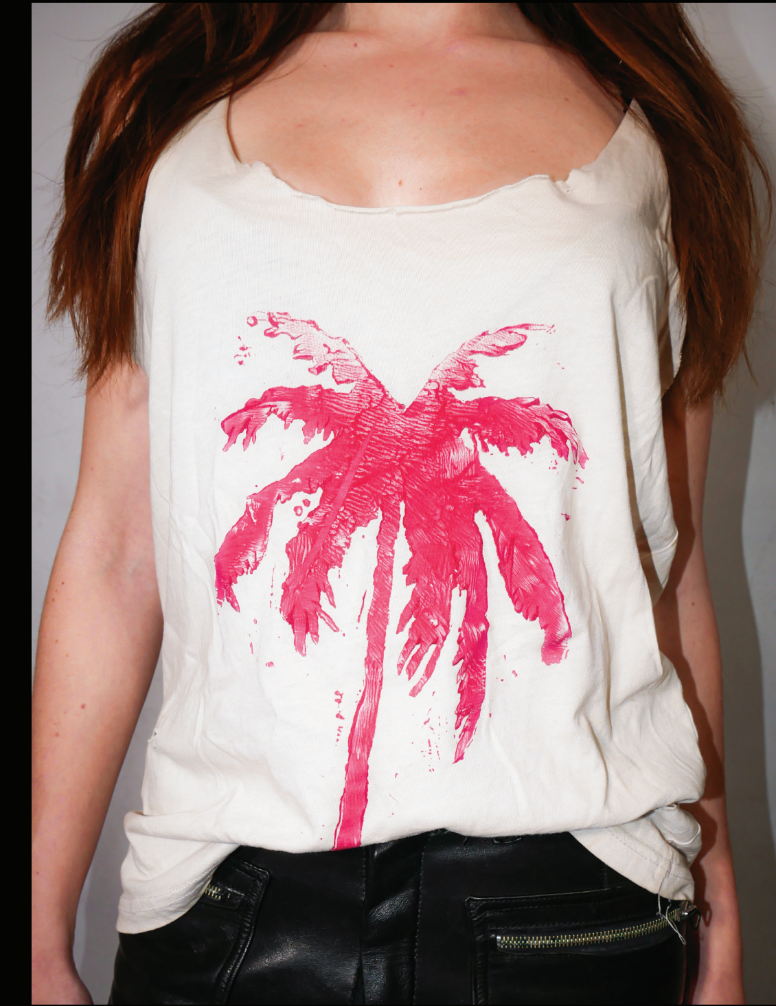
PALMTREE TANK - TANKTOP

Een bekend religieus beeld, maar dan anders. De boodschap is simpel religie als instituut wordt hier afgewezen. Jezus niet als heilige, maar als rebel.