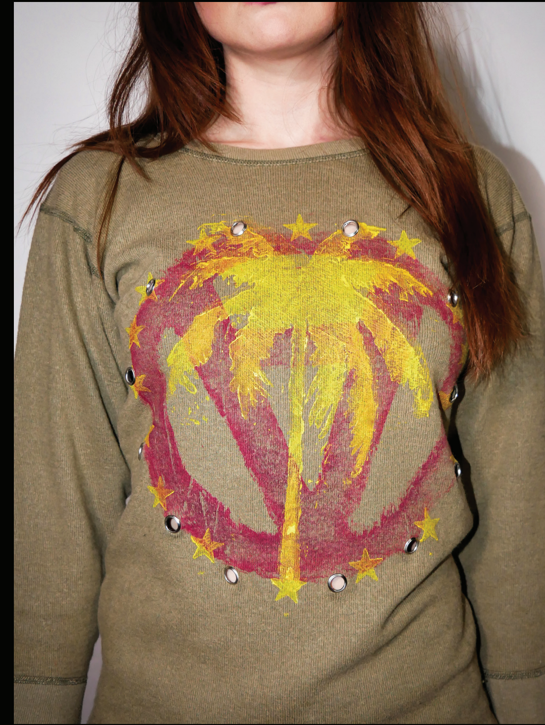
SUMMER NEVER CAME - SWEATER

Toch blijft de top licht en strak, bijna onschuldig. Dat is precies waar het om gaat. Gevangen zien er soms ook gewoon uit als mensen.